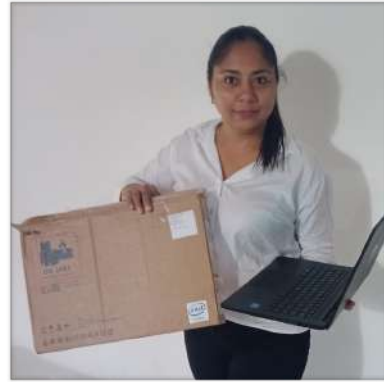
Lahidenela San Juan CAT Barranquilla