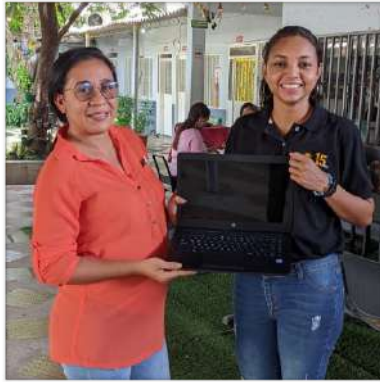
Rosa CAT Bosconia