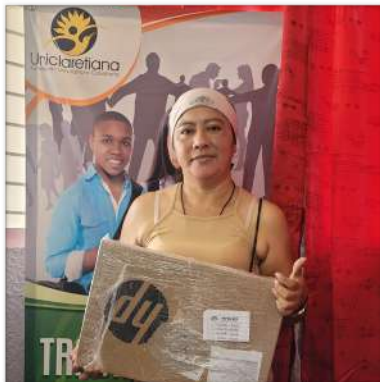
Nimia Pastora Urariyu Epiayu CAT Uribia