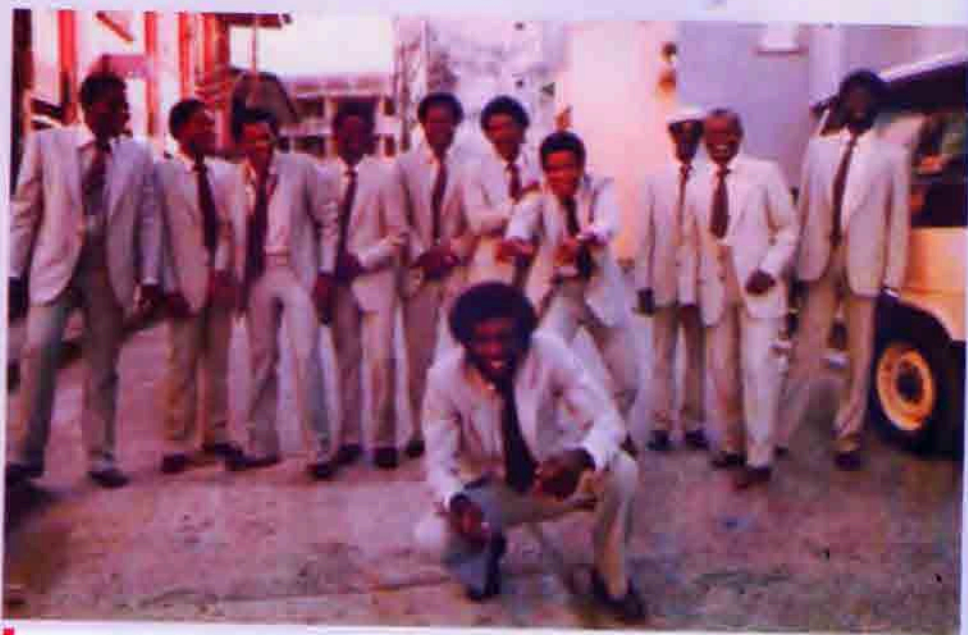
Integrantes banda San Francisco de Asís

Niños y niñas soñamos tiempo atrás en llegar a ser un día músicos e integrar tan sublime agrupación. Hoy cuando es realidad la metamorfosis de una banda machista, por otra con una amplia participación de las féminas, podemos decir que la tenemos como un buen referente cultural para las nuevas generaciones "la banda se convirtió en una verdadera institución para la difusión de la cultura musical chocoana, gracias a sus magistrales presentaciones en: retretas de gala en el parque del Centenario, que en el nuevo milenio han sido rescatadas por la alcaldía municipal que preside Francis Ceballos Mosquera 1 , efemérides, procesiones de semana santa y espectáculos de gala en honor a personajes destacados y a visitantes ilustres que llegaban a la extinguida intendencia. La banda musical de San Francisco de la ciudad de Quibdó, fue el recuadro cultural para recibir y despedir en el puerto aéreo de Quibdó a quienes viajaban en los hidroaviones SCADTA y CATALINA"