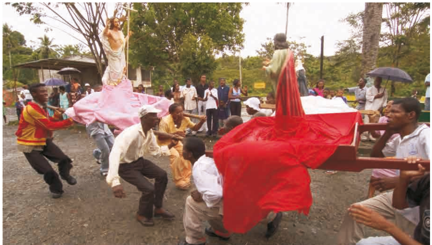
El pueblo afro, al apropiarse sus Santos, traslada a estos su comportamiento. Aquí los Santos bailan como el pueblo y el pueblo goza con sus Santos.