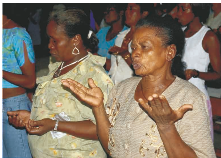
El pueblo carga de espiritualidad acontecimientos dolorosos, gozosos y piadosos.