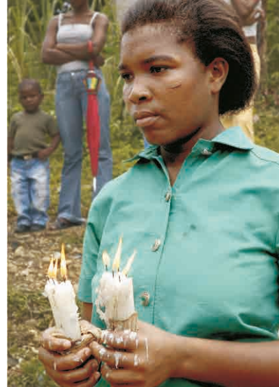
La espiritualidad afro queda reflejada en actitudes y rostros

rituales y en general la cosmovisión afrocolombiana a partir de la diáspora, representan ya esfuerzos meritorios, aunque aislados, por entender y enfrentar la dimensión de expresiones culturales que no solo se pueden entender como rito de ocasión o festividad sino como fenómenos que se enraizan con los orígenes y se han transformado a lo largo de las diáspora inicial y de las diásporas internas, sobre todo con la migración a las ciudades, a partir de los ancestrales elementos religiosos y cosmogónicos.